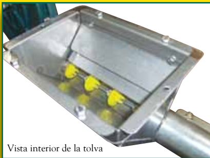
Vista interior de la tolva