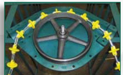
Unidad de esquina abierta con cadena